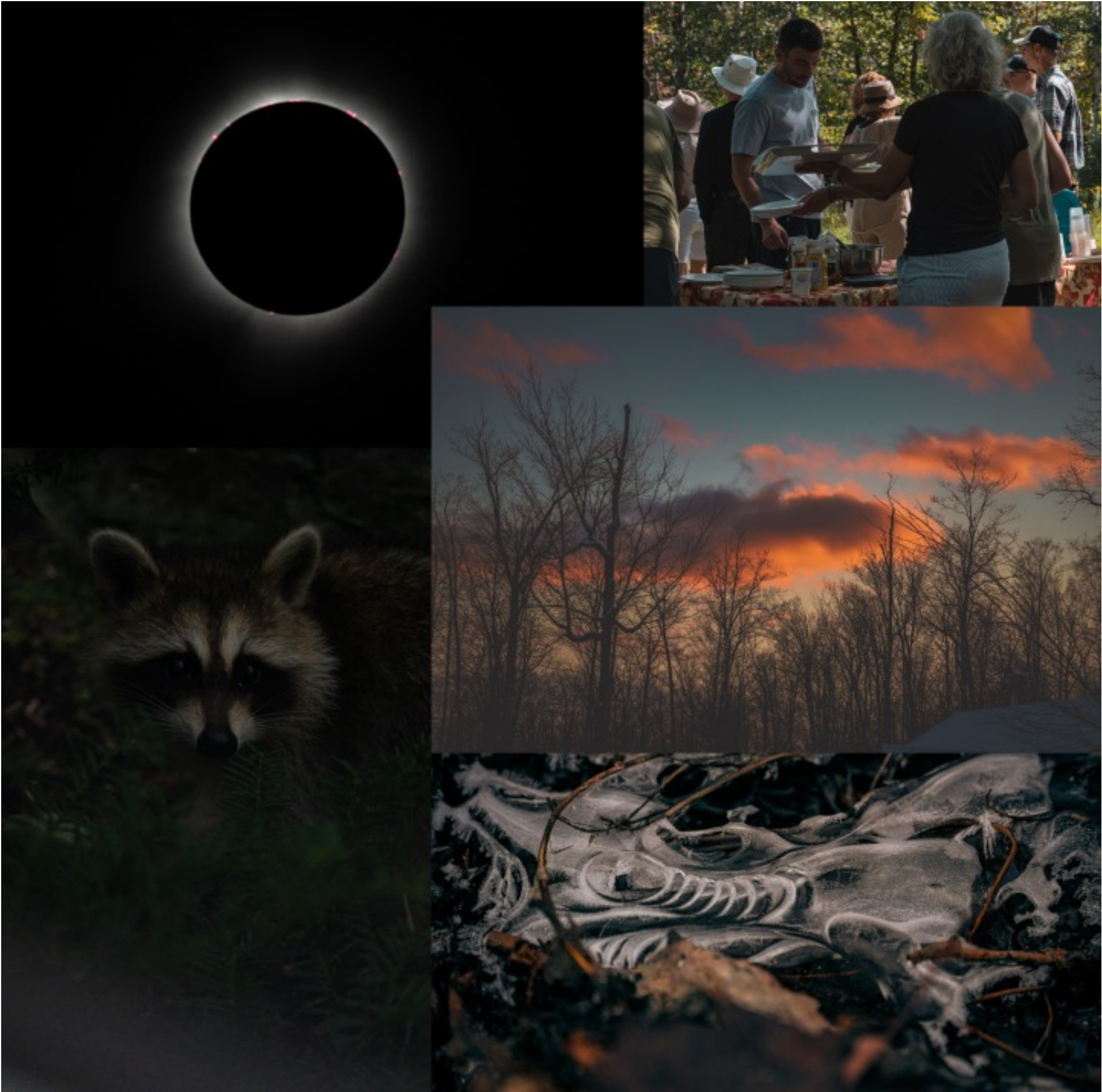
Les photos de l'édition 2024 de la Feuille d'Érable sont une réalisation de Félix-Olivier Rioux.

Quels privilèges ! Oui, quand je regarde ce qui m'entoure, je me sens millionnaire.